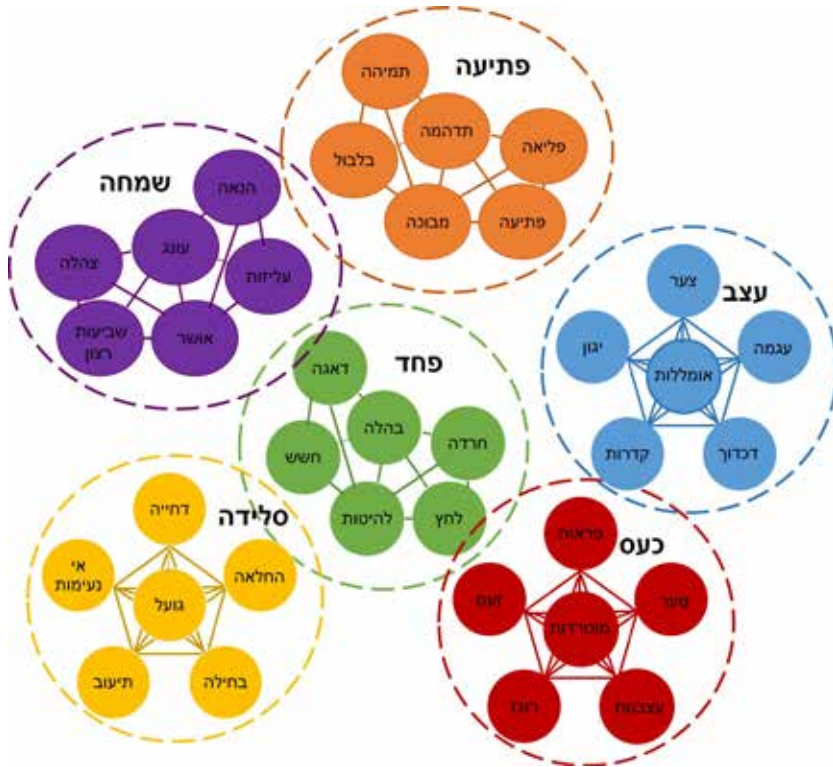
תרשים 2: מיון, מיפוי ורגשות בסיס על פי סארמקי ועמיתיו (Saarimäki et al., 2015)